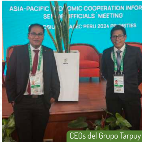
CEOs del Grupo Tarpuay