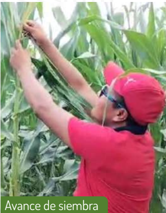
Avance de siembra