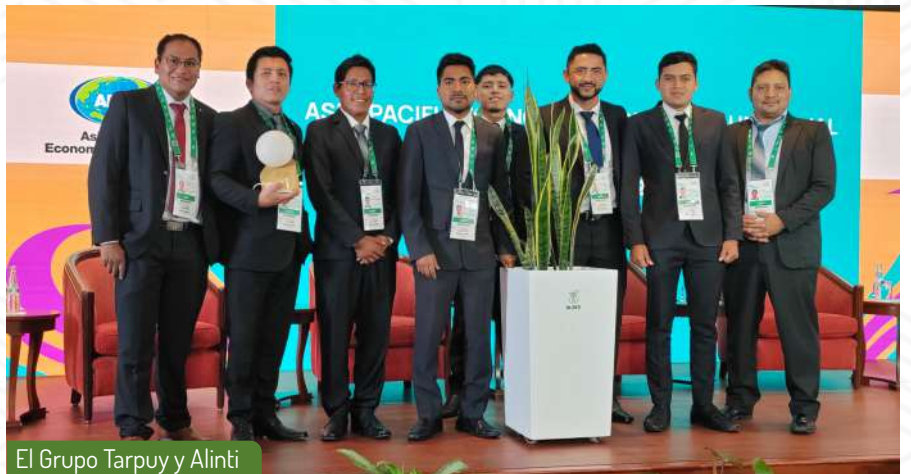
El Grupo Tarpuay y Alinti