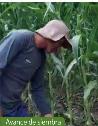
Avance de siembra