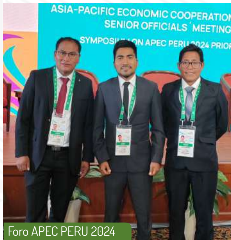
Foro APEC PERU 2024