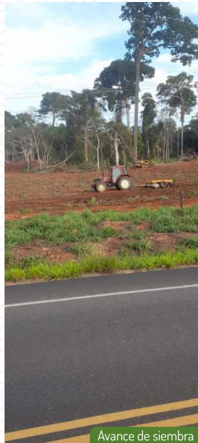
Avance de siembra

Nos complace informarles sobre los emocionantes avances en nuestro proyecto agroindustrial Villa Dorada en Puerto Maldonado. Durante el último mes, hemos alcanzado hitos significativos en el proceso de siembra, marcando un paso más hacia la materialización de nuestra visión agroindustrial. Nuestro compromiso con la excelencia agrícola y estamos entusiasmados por los resultados que se avecinan.