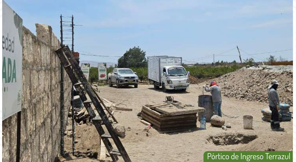
Pórtico de Ingreso Terrazul

logro marca el camino hacia un estilo de vida excepcional, donde la elegancia y la funcionalidad se unen en perfecta armonía. Les invitamos a compartir nuestra emoción por este hito que nos acerca más a convertir sueños en hogares.