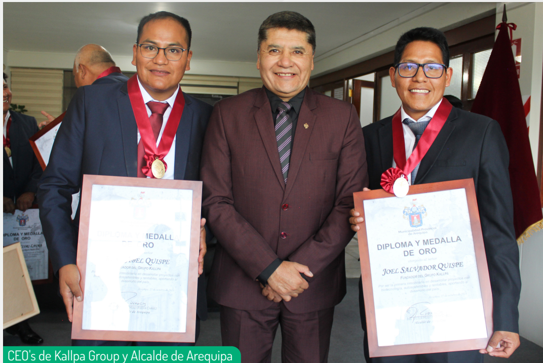
CEO's de Kallpa Group y Alcalde de Arequipa