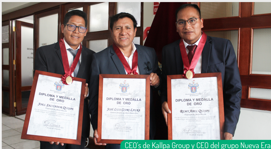
CEO's de Kallpa Group y CEO del grupo Nueva Era

Queremos agradecer a todos nuestros colaboradores, socios y clientes por su apoyo inquebrantable. Esperamos seguir contribuyendo al crecimiento de Arequipa y del Perú. Juntos, alcanzaremos nuevas alturas y seguiremos marcando la diferencia en nuestro hermoso país.