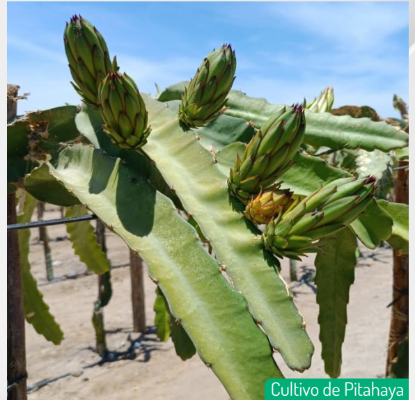
Cultivo de Pitahaya

En Kallpa Group, nos esforzamos constantemente por alcanzar la excelencia agrícola, y cada paso que damos refleja nuestro compromiso con la calidad y la innovación. ¡Gracias por ser parte de nuestra comunidad y estar al tanto de nuestros emocionantes avances!