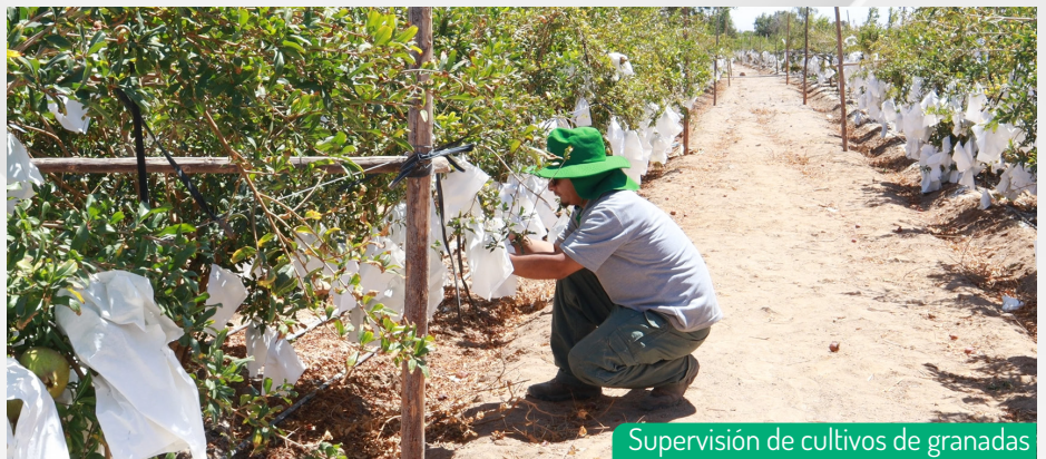
Supervisión de cultivos de granadas

Nuestra supervisión minuciosa garantiza que estos cultivos estén en perfectas condiciones, lo que se traducirá en un producto de alta calidad. Creemos firmemente que la diversificación de nuestros proyectos solo fortalece nuestro compromiso de ofrecer a nuestros clientes las mejores opciones para inversión y vivienda.