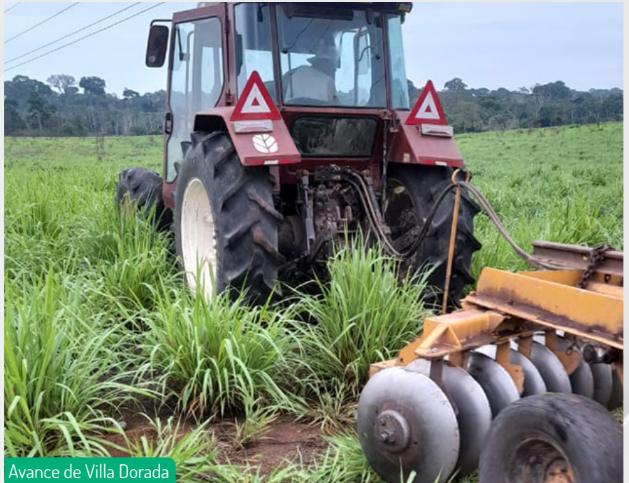
Avance de Villa Dorada

Los cultivos son un testimonio de nuestro esfuerzo constante por integrar la agricultura y la inmobiliaria en un enfoque único y transformador. Creemos firmemente que esta sinergia nos permitirá continuar creciendo y marcando la diferencia en el panorama inmobiliario.