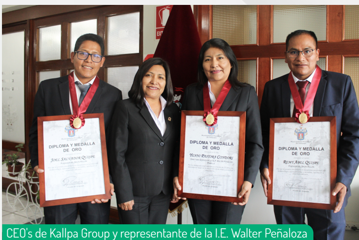
CEO's de Kallpa Group y representante de la I.E. Walter Peñaloza