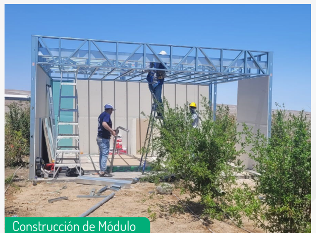
Construcción de Módulo

Agradecemos su continuo apoyo y entusiasmo. ¡Estén atentos a más actualizaciones y detalles emocionantes sobre TERRAZUL! ¡La visión de su nuevo hogar está un paso