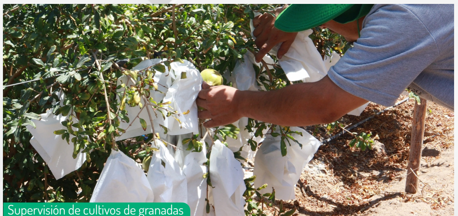
Supervisión de cultivos de granadas