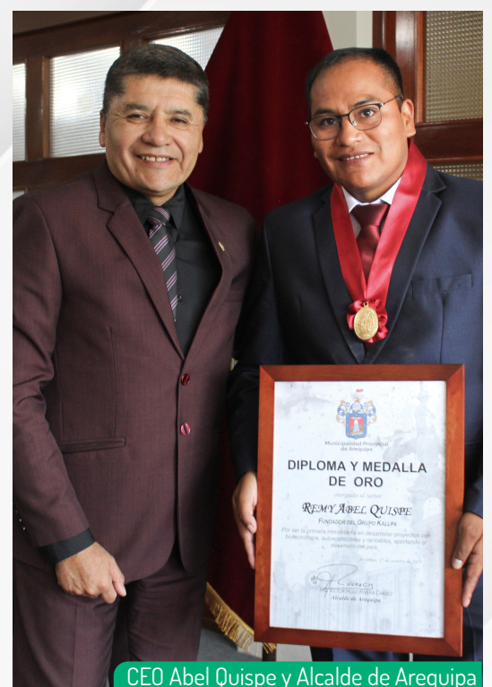
CEO Abel Quispe y Alcalde de Arequipa