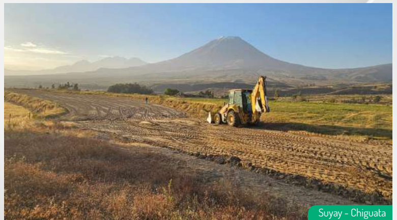
Suyay - Chiguata

Durante su visita, podrán presenciar el increíble avance de nuestro proyecto. Nuestros asesores inmobiliarios estarán a su disposición para guiarlos y responder a todas sus preguntas, además de conocer más de nuestro proyecto y adquirir tu terreno para casa de campo.