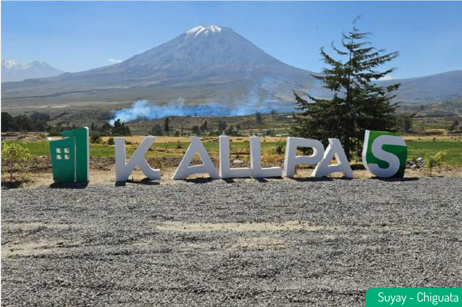
Suyay - Chiguata