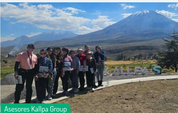
Asesores Kallpa Group

Así que, si están interesados en ser parte de un proyecto que redefinirá su perspectiva sobre la vida en el siglo XXI, les extendemos una invitación cordial para unirse a nosotros en Suyay en Chiguata. Este no es solo un proyecto de viviendas, es un estilo de vida sostenible que estamos seguros les encantará.