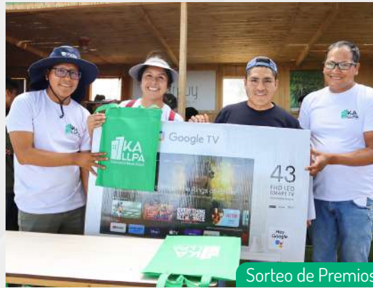
Sorteo de Premios