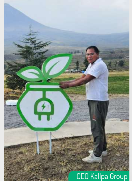
CEO Kallpa Group