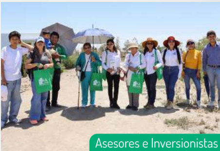
Asesores e Inversionistas