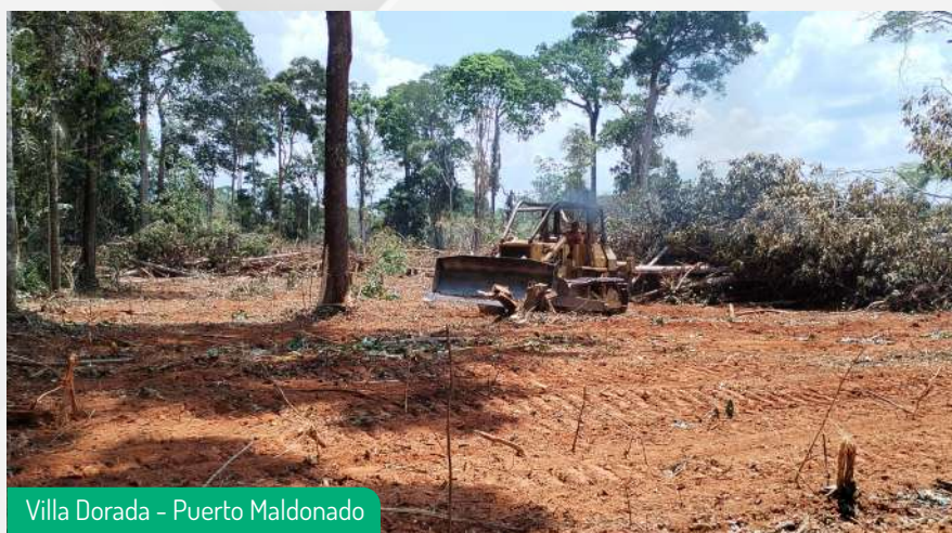
Villa Dorada - Puerto Maldonado