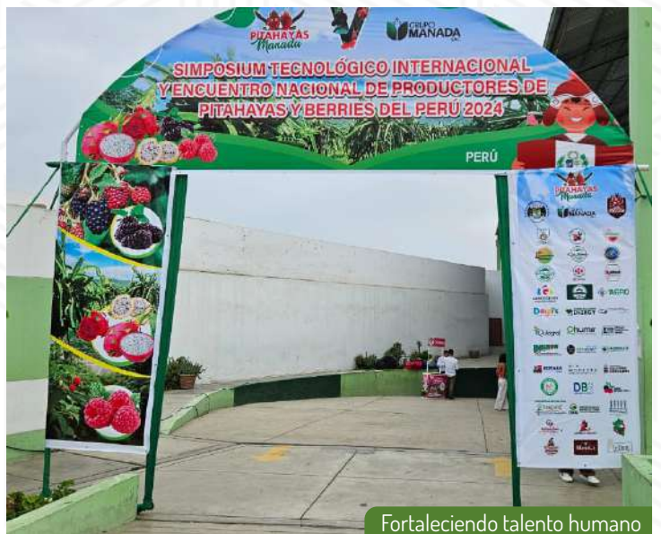
Fortaleciendo talento humano