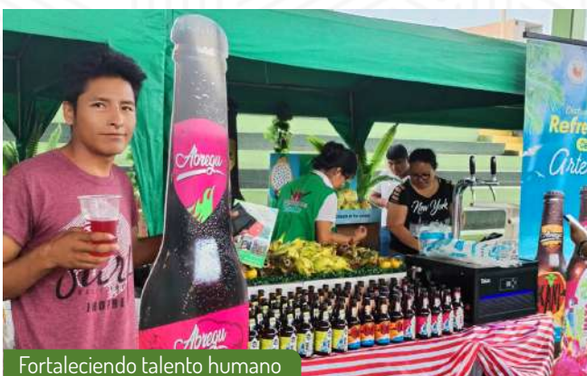
Fortaleciendo talento humano