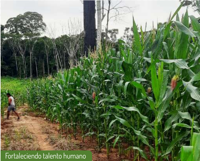
Fortaleciendo talento humano