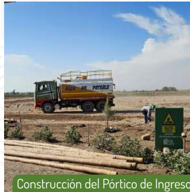
Construcción del Pórtico de Ingreso