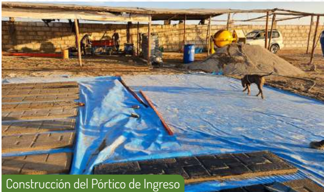
Construcción del Pórtico de Ingreso