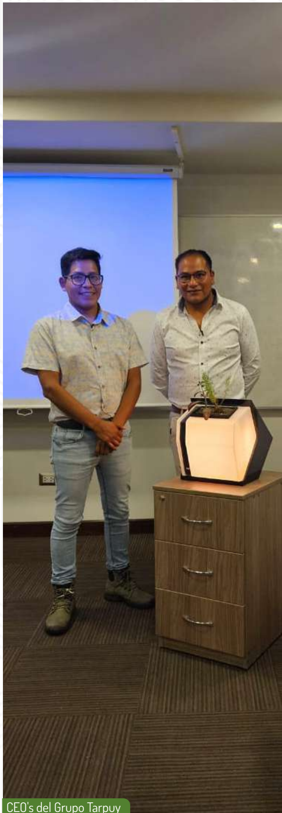
CEO's del Grupo Tarpuy