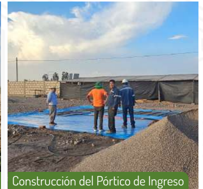
Construcción del Pórtico de Ingreso

Nos complace informarles sobre los avances en la construcción del Pórtico de Ingreso de nuestro proyecto TERRAZUL en San Isidro - La Joya , el cuál será inaugurada el 14 de abril. Nuestro equipo está trabajando diligentemente en los preparativos necesarios para garantizar que este proyecto se lleve a cabo de manera eficiente y exitosa.