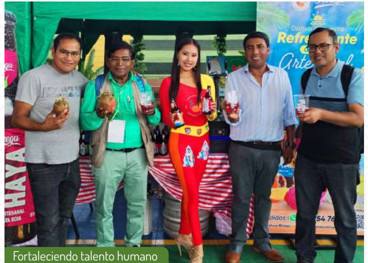
Fortaleciendo talento humano

Creemos firmemente que invertir en el crecimiento de nuestro talento humano nos permite innovar y alcanzar nuevos niveles de éxito en el mercado. Seguiremos buscando oportunidades similares para seguir creciendo y brindando un valor excepcional a nuestros clientes y colaboradores.