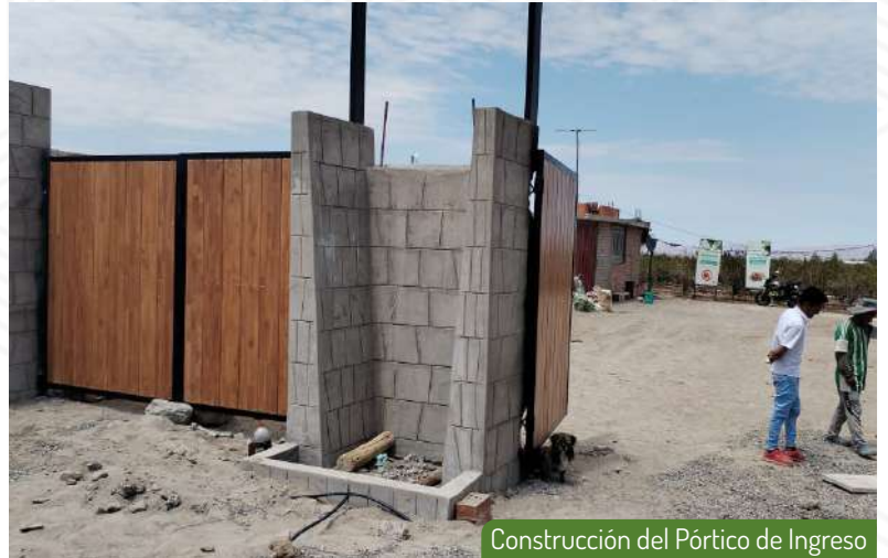
Construcción del Pórtico de Ingreso