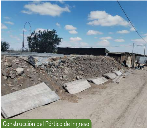
Construcción del Pórtico de Ingreso