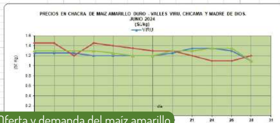
Oferta y demanda del maíz amarillo