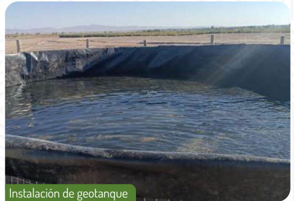
Instalación de geotanque

Estamos emocionados por los beneficios que esta iniciativa traerá a nuestra comunidad y esperamos seguir explorando nuevas oportunidades para promover prácticas ecoamigables en todas nuestras iniciativas.