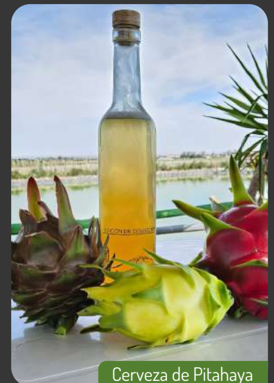
Cerveza de Pitahaya

Grupo Tarpuy espera con entusiasmo compartir más avances y logros en la industrialización de la pitahaya en los próximos meses, reafirmando nuestro compromiso con la innovación y la calidad en cada paso que damos.