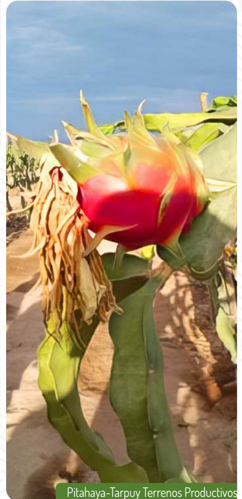
Pitahaya-Tarpuy Terrenos Productivos