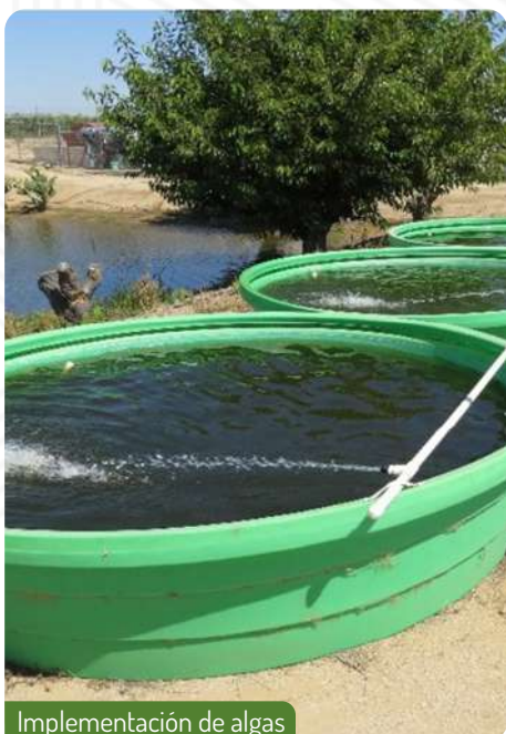
Implementación de algas

Grupo Tarpuy se complace en anunciar un paso significativo hacia la sostenibilidad y la eficiencia agrícola en nuestro proyecto Tarpuy - Terrenos Productivos, dedicado a la producción de pitahayas en San Isidro - La Joya. Recientemente, hemos implementado una tecnología innovadora que incorpora algas marinas en nuestros abonos orgánicos. Esta iniciativa no solo fortalece la salud del suelo y de las plantas, sino que también reduce nuestra huella ambiental.