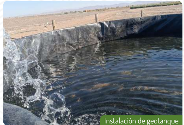
Instalación de geotanque