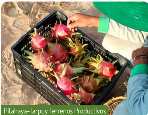
Pitahaya-Tarpuy Terrenos Productivos