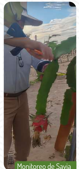
Monitoreo de Savia