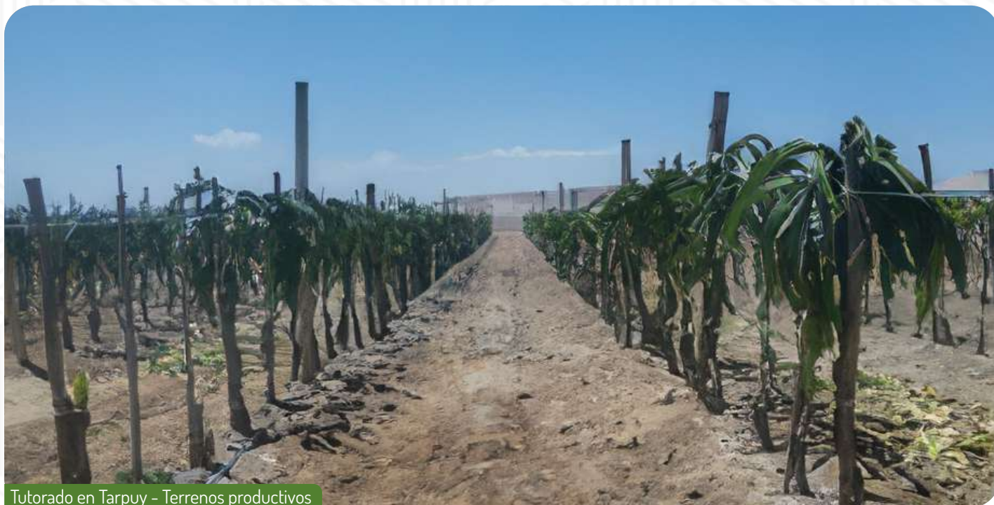
Tutorado en Tarpuy - Terrenos productivos