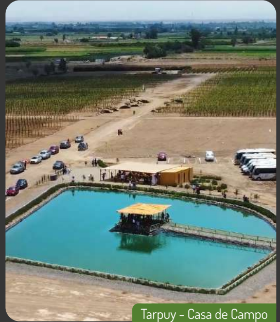
Tarpuy - Casa de Campo

Con este importante avance en la fase de planificación, nos acercamos cada vez más a hacer realidad este gran proyecto y esperamos continuar compartiendo más logros con nuestra comunidad a medida que seguimos avanzando.