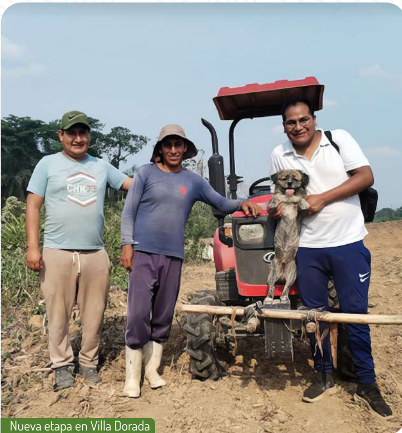
Nueva etapa en Villa Dorada

Nos complace anunciar que hemos comenzado el proceso de preparación del terreno en nuestro fundo de Villa Dorada, marcando el inicio de una nueva etapa emocionante para nuestro proyecto agroindustrial. Este paso fundamental es clave para garantizar una siembra exitosa y una cosecha abundante.