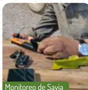
Monitoreo de Savia