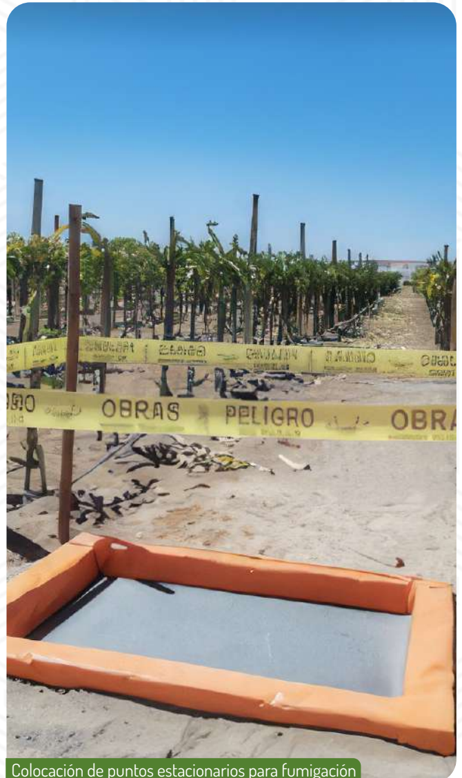
Colocación de puntos estacionarios para fumigación

Grupo Tarpuy sigue demostrando su compromiso con la adopción de tecnologías agrícolas avanzadas. El uso de estos puntos de fumigación representa un paso importante hacia un manejo agronómico más sostenible y eficaz, asegurando la calidad de nuestras cosechas.