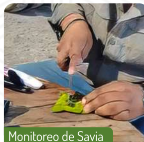
Monitoreo de Savia

Con esta estrategia, buscamos no solo mejorar la eficiencia en la fertilización, sino también promover un crecimiento robusto y una cosecha de alta calidad. Este esfuerzo refleja nuestro compromiso en la producción de pitahayas.